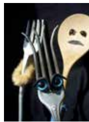
Coeur de cuillère