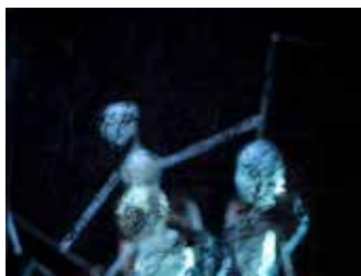
2010 : La Métamorphose d'après Franz Kafka