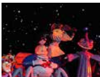
2005 : Starmoire idée originale C.Roche, I.Pommet