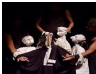
2010 : Molière 2 (Le Médecin Volant + La Jalousie du Barbouillé) de Molière