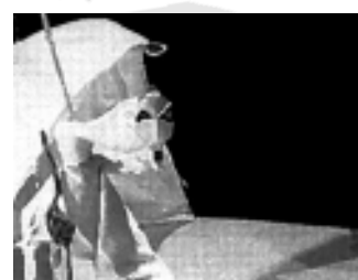
1996 : Tubiane idée originale Ivan Pommet