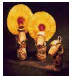
Roméo et Juliette, les amants de liège

Depuis sa création le Théâtre MU complète son activité de création en proposant des ateliers et stages de pratique artistique. Ils concernent autant les enfants que les adultes. Toujours en rapport direct avec nos spectacles, le but de ces temps d'interventions et de formations est de faire découvrir une méthode de travail propre à nos créations.