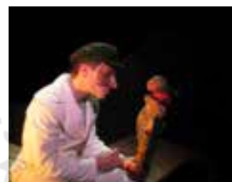
2005 : iago d'après « Othello » de W. Shakespeare et « Jalousie » de C. Nougaro