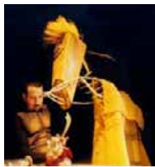
Péplum Poids Plume

Les marionnettes, faites d'objets détournés et de matériaux de récupération, sont des amorces d'imaginaire permettant de s'élancer vers des aventures originales, souvent issues des grands thèmes dramatiques classiques. Ces personnages dérisoires, faits de bric et de broc, vous racontent tour à tour l'amour, la haine, l'esclavage, la colère, le respect, le courage, le désespoir, la vie ou la mort... Leur fragilité et leur apparente faiblesse nous les rendent plus familiers, plus touchants et donc plus convaincants.