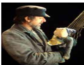
2007 : Pierre et le vieux loup de mer idée originale Christophe Roche