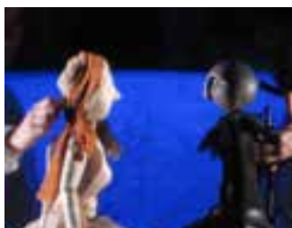
2007 : Desdemona & Othello d'après « Othello » de W. Shakespeare et « Jalousie » de C. Nougaro