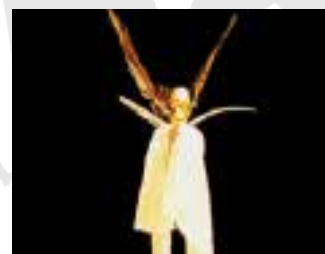
2001 : Plume d'Ange idée originale Ivan Pommet