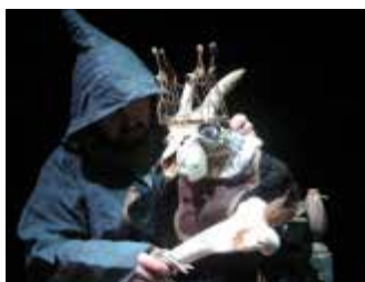
2008 : Escurial de Michel de Ghelderode