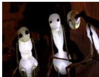
2013 : Paradox idée originale Ivan Pommet