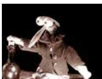
1996 : Lumières ! idée originale Ivan Pommet