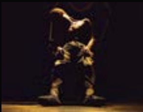
2015 : Renkonti idée originale Ivan Pommet