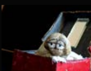
1997 : Petit comme un caillou idée originale Ivan Pommet