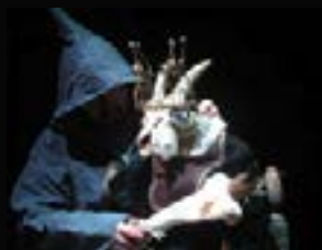
2008 : Escurial de Michel de Ghelderode