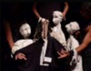
2010 : Molière² (Le Médecin Volant + La Jalousie du Barbouillé) de Molière