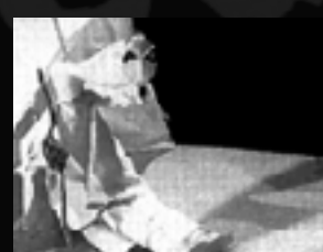
1996 : Tubiane idée originale Ivan Pommet