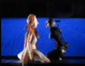
2007 : Desdemona & Othello d'après « Othello » de W. Shakespeare et « Jalousie » de C. Nougaro