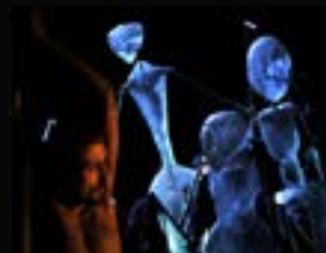
2010 : La Métamorphose d'après Franz Kafka