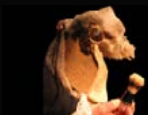
2007 : Purgatoires idée originale Ivan Pommet