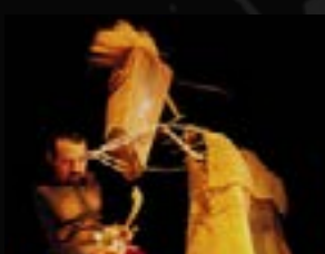
2002 : Peplum poids plume idée originale Ivan Pommet