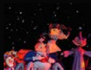
2005 : Starmoire idée originale C.Roche, I.Pommet