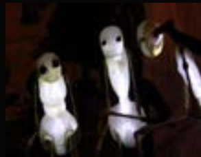
2013 : Paradox idée originale Ivan Pommet