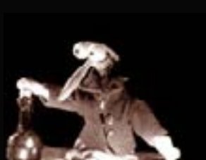
1996 : Lumières ! idée originale Ivan Pommet