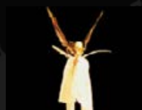
2001 : Plume d'Ange idée originale Ivan Pommet