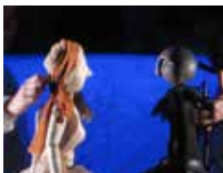
2007 : Desdemona & Othello d'après « Othello » de W. Shakespeare et « Jalousie » de C. Nougaro