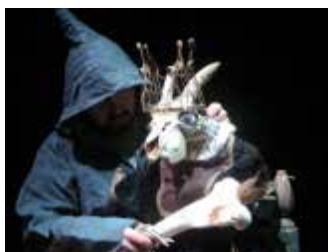
2008 : Escurial de Michel de Ghelderode