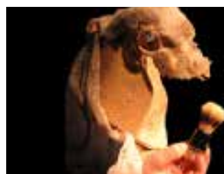
2007 : Purgatoires idée originale Ivan Pommet