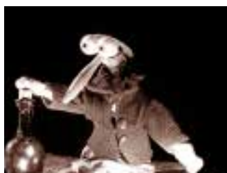
1996 : Lumières ! idée originale Ivan Pommet